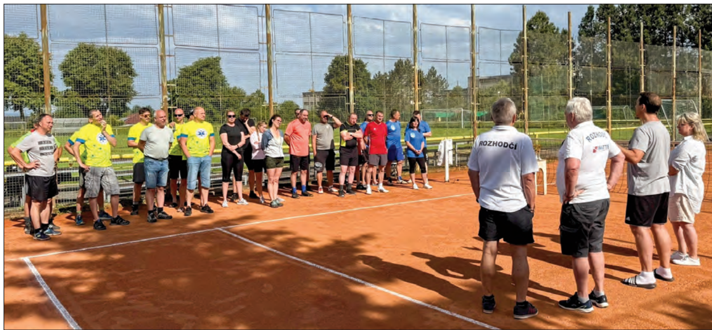
Ranní nástup družstev i s pomocným personálem

S umístěním dnes začneme od konce. Čulibrka si letos odvezla