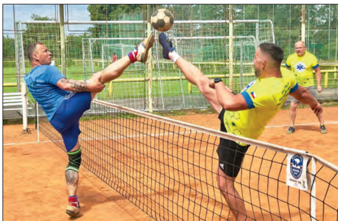
Mistrovská hra, zápas Františkovy lázně – ZZS Olomouc