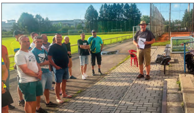
Večerní vyhlášení výsledků bylo plně slunce i úsměvů