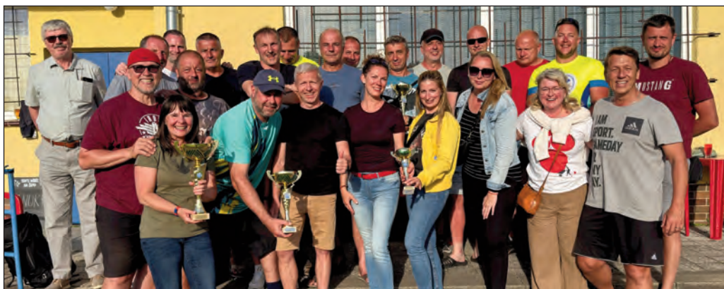
Bez společné fotky by to nebylo ono