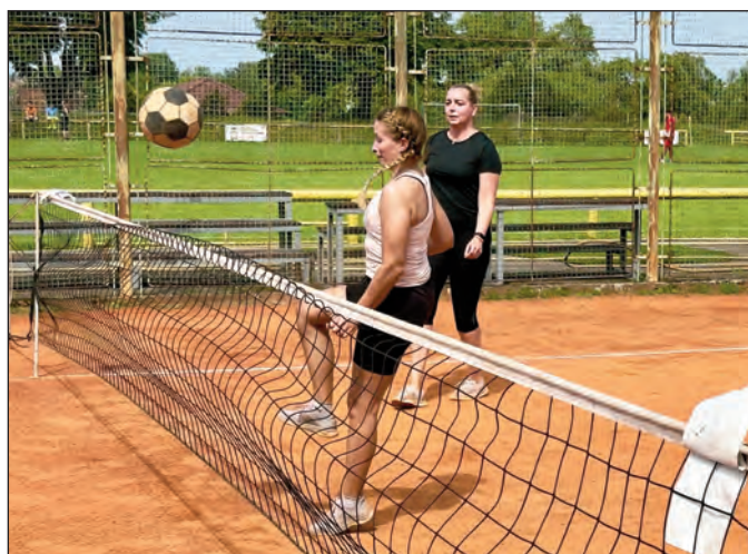
Skoro jsem se trefila!