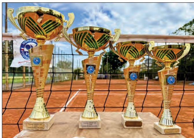
Letošní trofeje byly lákavé