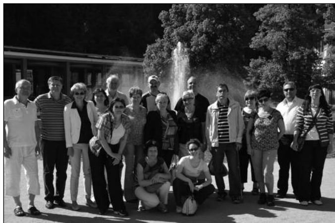
Společné foto pro kampaň za vodu