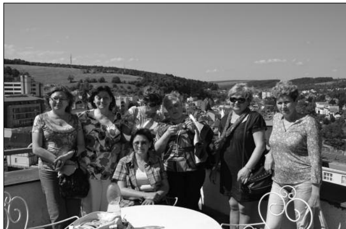
Momentka z exkurze