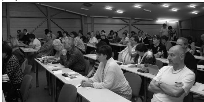
Účastníci konference velmi pozorně naslouchali panelové diskuzi

o základnu stávající bylo hlavní náplní konference a do budoucna je to permanentní úkol všech funkcionářů OS.