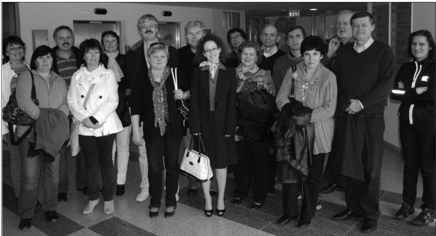
Česká a slovenská delegace ve FN Motol

zákonný nárok na přiměřenou odměnu – přiměřené je to, co bylo vyjednáno v kolektivních smlouvách, mnoho zaměstnavatelů tuto odměnu však neplatí, využívají toho, že učni nevědí, jaký mají nárok.