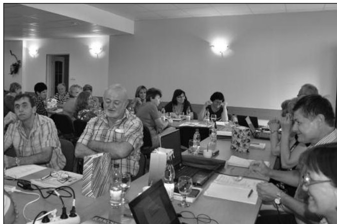
Na jednání vládla dobrá atmosféra