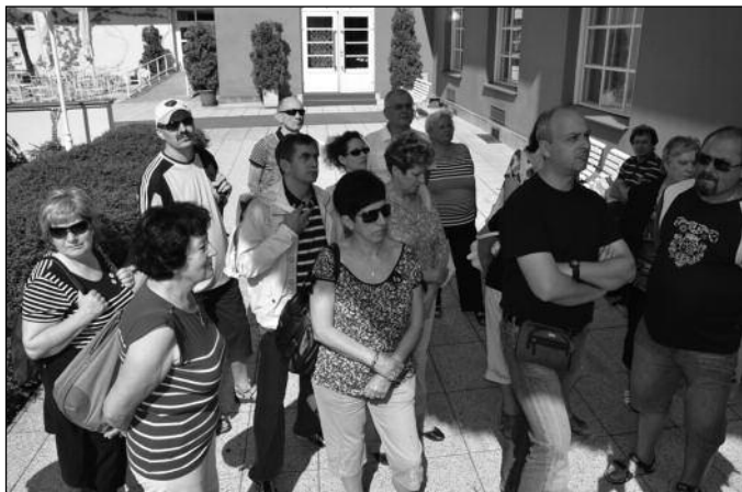
Prohlídka lázeňských prostor