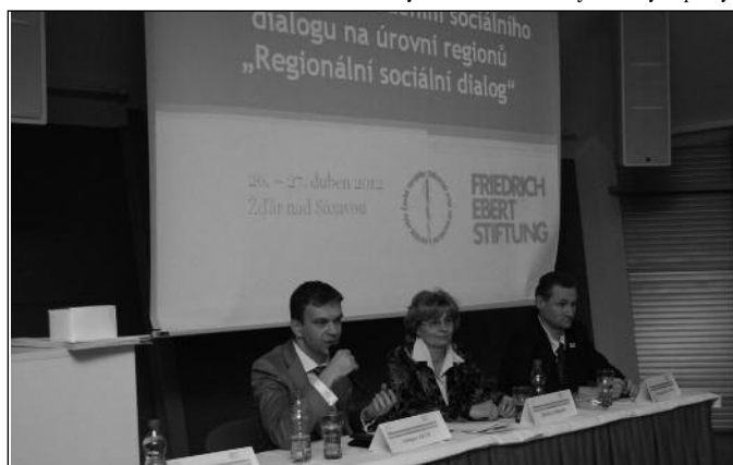
Jednání konference se zúčastnili i zástupci Kraje Vysočina a Asociace poskytovatelů sociálních služeb

Výkonná rada konstatovala, že oblast sociálních služeb nedošlo k žádnému hmatatelnému posunu k lepšímu. Systém úhrady financí na činnosti jednotlivých posky-