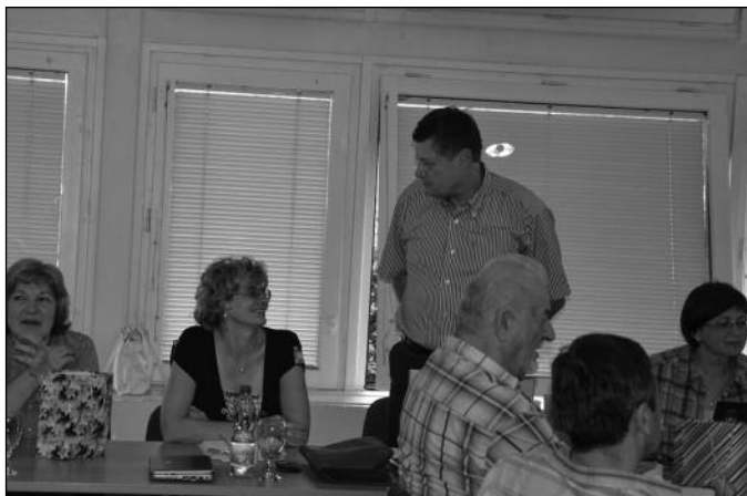
Vedení obou partnerských odborových svazů