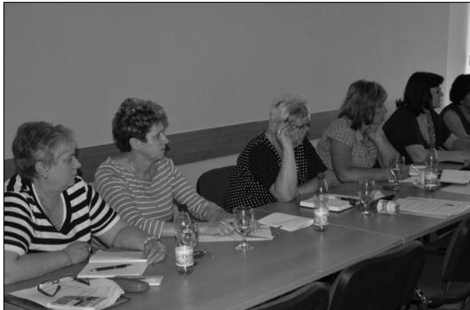
První den jednání výkonné rady OSZSP ČR

Informace o konání Sněmu ČMKOS se zaměřila na postoj svazů ke generální stávce.