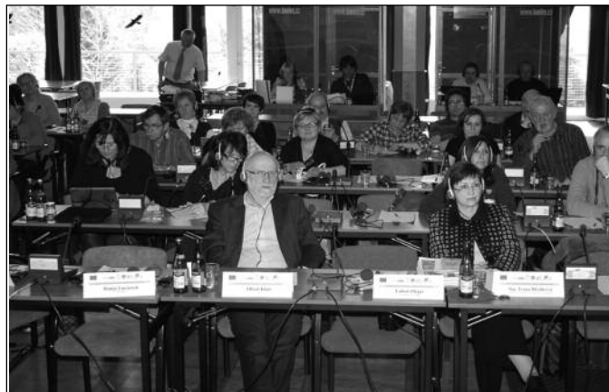
Účastníci konference v jednacím sále