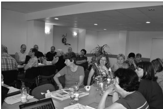
Účastníci jednání pozorně poslouchali