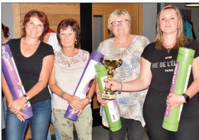
2. místo ženy - Oblastní nemocnice Jičín