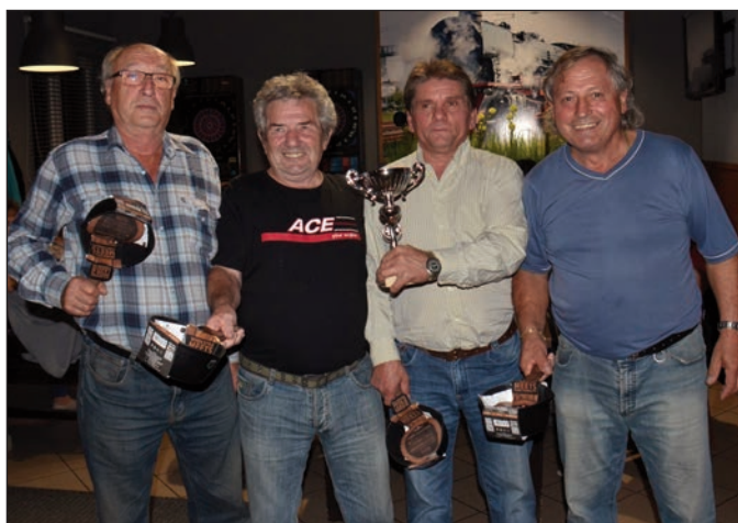
2. místo muži - veteráni z FN Brno