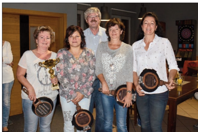
1. místo ženy - FN Plzeň, ZO II