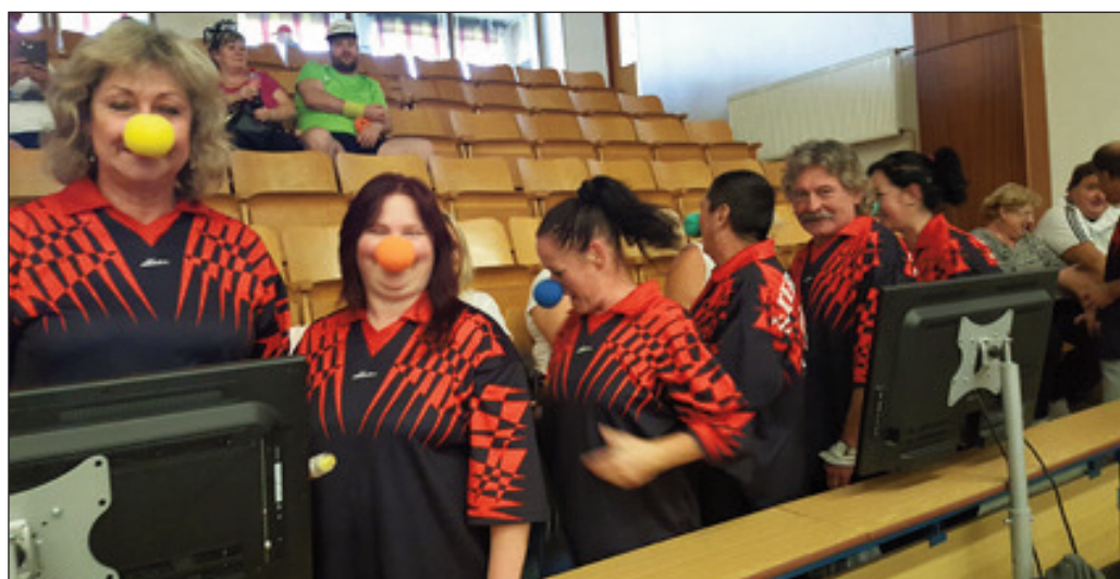
Nástup družstva Psychiatrické léčebny Šternberk