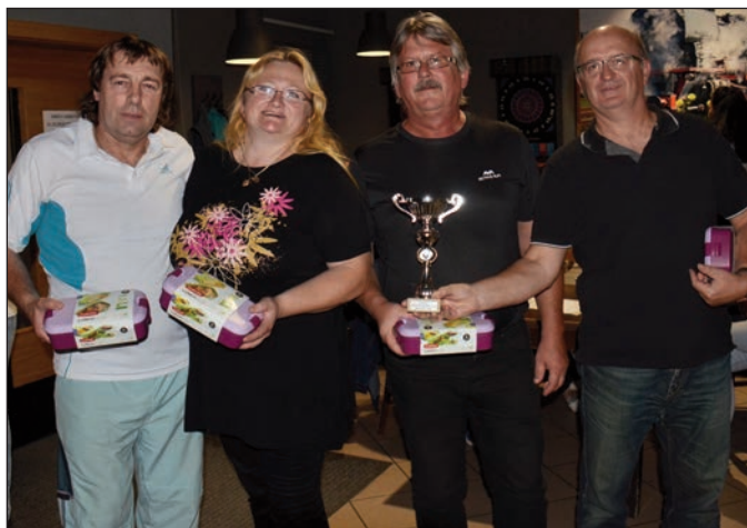
3. místo - smíšené družstvo Oblastní nemocnice Jičín