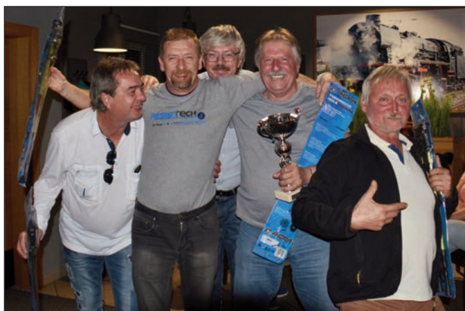
1. místo muži - Thermal Karlovy Vary