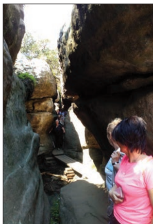
Túra ve Stolových horách