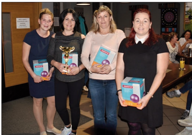
3. místo ženy - PN Opava